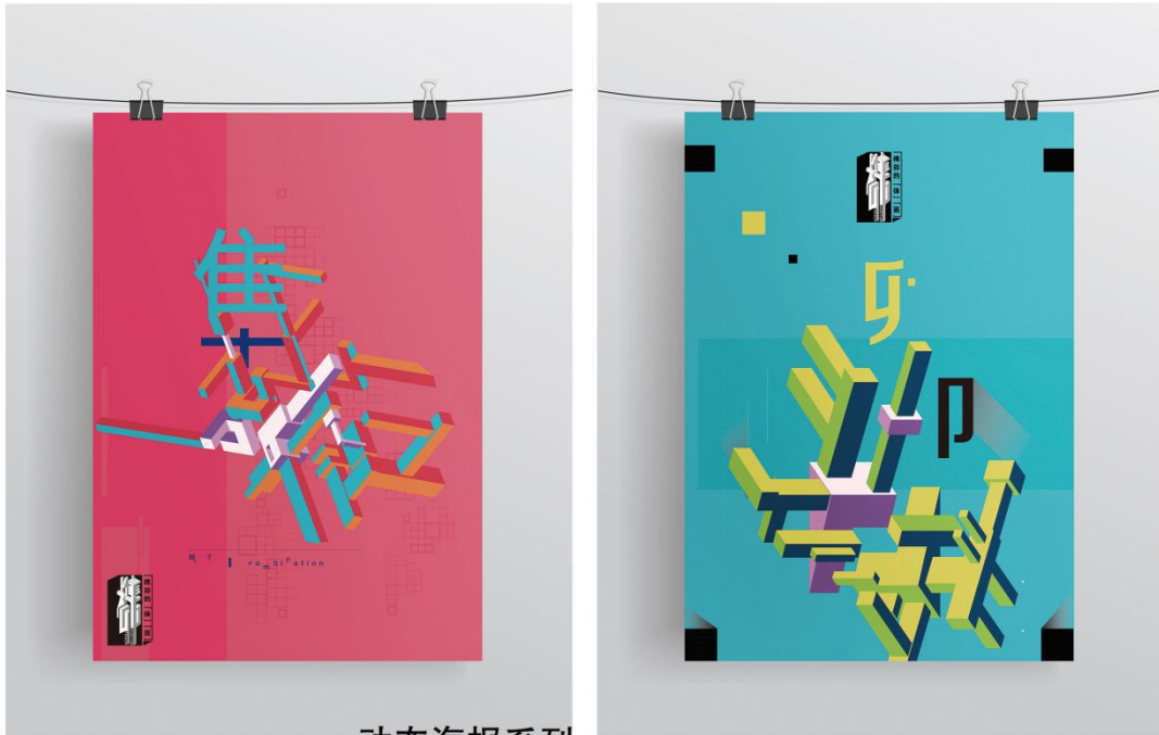
动态海报系列 Active Posters